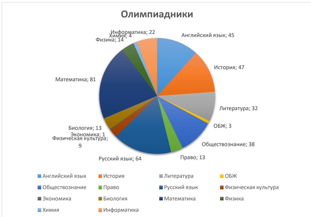
Диаграмма по участию обучающихся во ВсОШ

всероссийского и международного уровней. Результат – положительная динамика участия в олимпиадах и конкурсах, привлечение к участию в интеллектуальных соревнованиях большего количества обучающихся Школы.